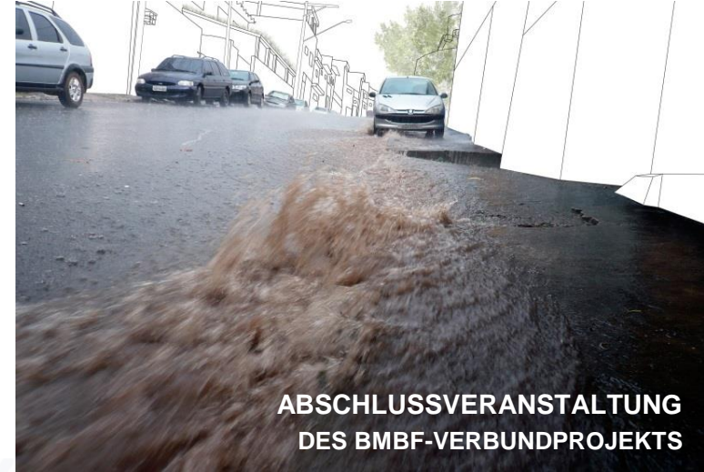
ABSCHLUSSVERANSTALTUNG DES BMBF-VERBUNDPROJEKTS